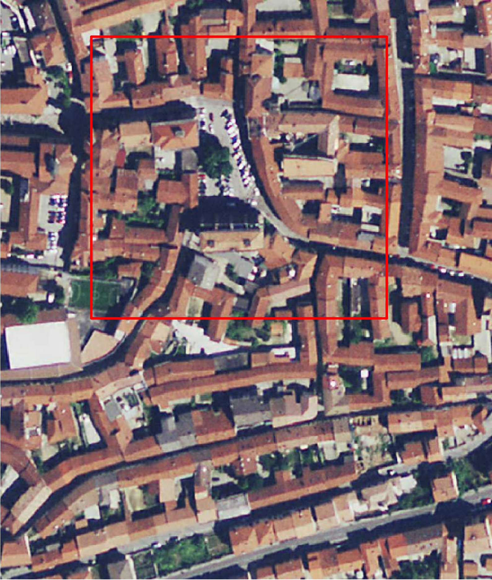
ORTOFOTO scala 1:1000