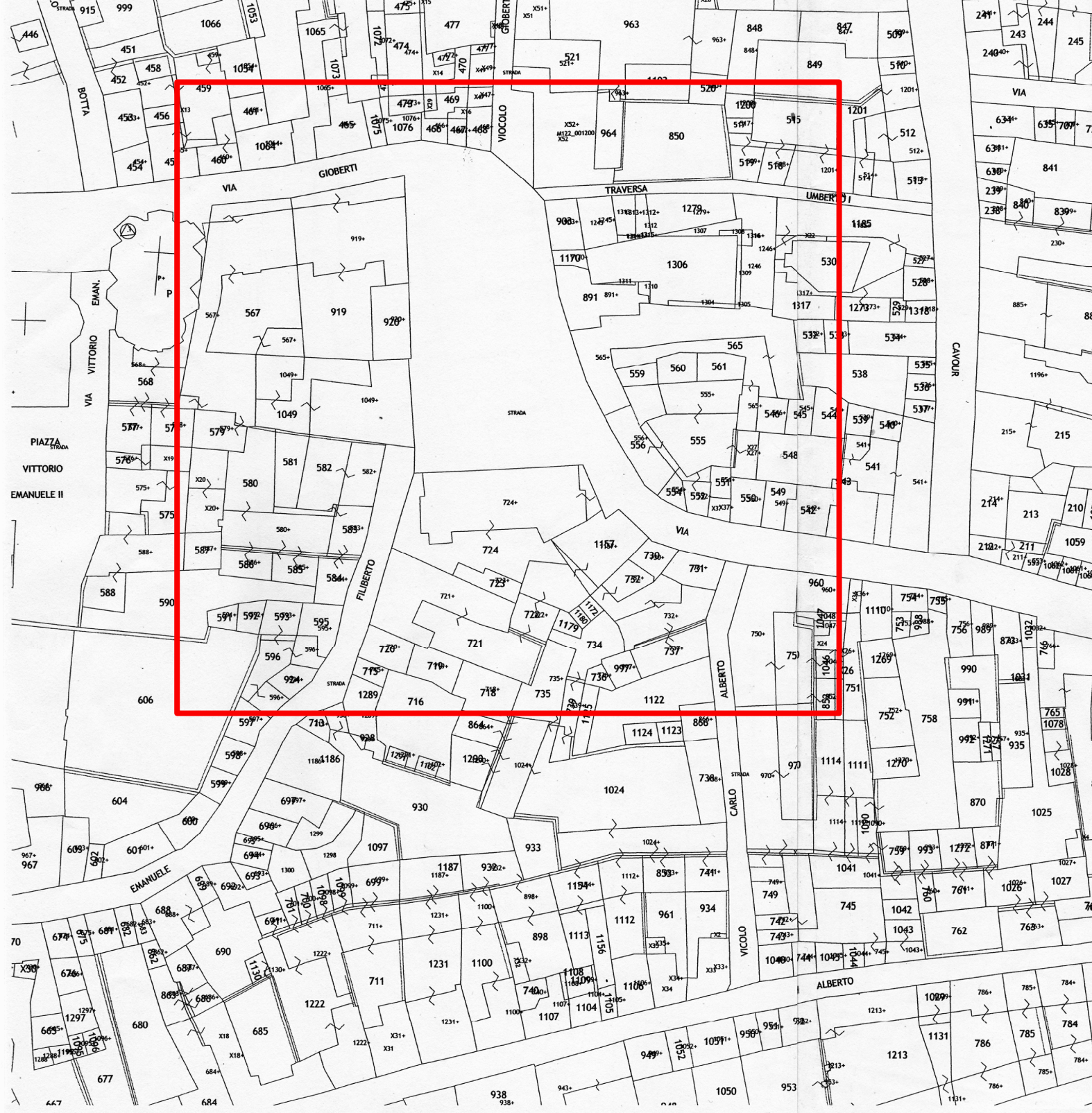
CATASTALE scala 1:1000